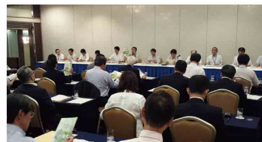
愛知労働局と民進党愛知県議員団との勉強会