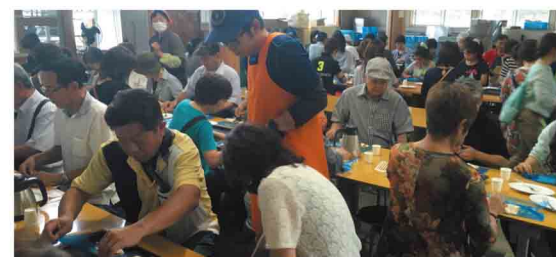
アップルパイづくり