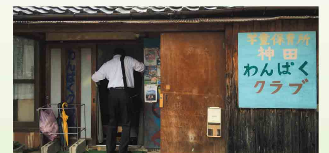
学童保育施設の様子