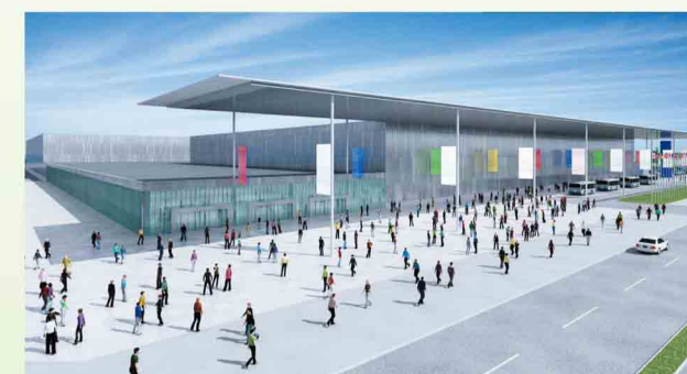
大規模展示場イメージ

※債務負担行為 予算は単一年度で完結するのが原則ですが、1つの事業や事務が単年度で終了せずに後の年度においても「負担=支出」をしなければならない場合に、あらかじめ後の年度の債務を約束することを予算で決め、これを債務負担行為といいます。