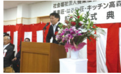
コロニー再編計画の一環、障害者支援施設はるひ荘の開所式

高齢化や重度化を理由に、計画の大幅な遅れを認めた。知事は「障害者が身近なところで、必要な支援や医療を受けて安心して暮らせるようさらに努力する」と答弁した。