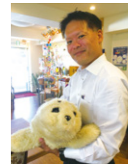
アニマルセラピー効果が期待される介護ロボット

また「あいちサービスロボット実用化支援センター」では、導入を検討している介護施設の職員に、常設しているロボットを実際に体験して