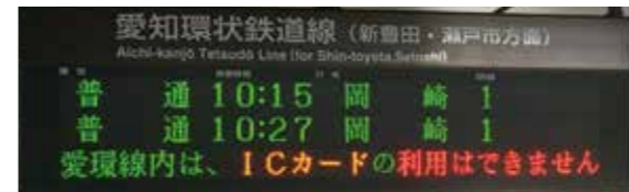
愛知環状鉄道はICカードが利用できません

県としても、利便性の高い鉄道ネットワークの形成を図る観点から、愛知環状鉄道へのICカード乗車券の導入は喫緊の課題と認識をしており、早期に導入ができるよう、沿線市とともに国庫補助金の確保に向けた要望活動を行うなど、会社の取組をしっかりと支えてまいります。