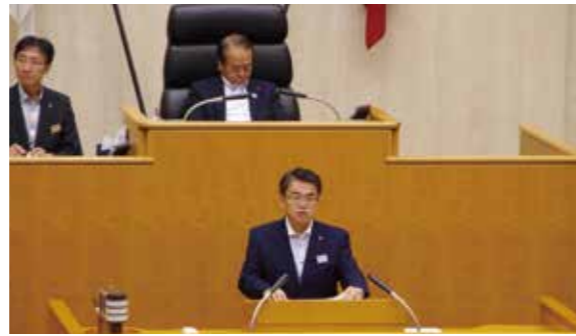
答弁する大村知事

《知事》 「社会的価値の実現」については、昨年7月に運用を開始してから、評価項目の指標の一つである「女性の活躍促進宣言」の提出企業が、273社から784社と2.9倍に、「あいち女性輝きカンパ