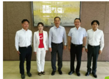
平成29年度民進党愛知県議員団五役

上述した委員会配属も含め、今まで以上に様々な役を頂きましたので、職責を全うすべく精いっぱい努力してまいります。