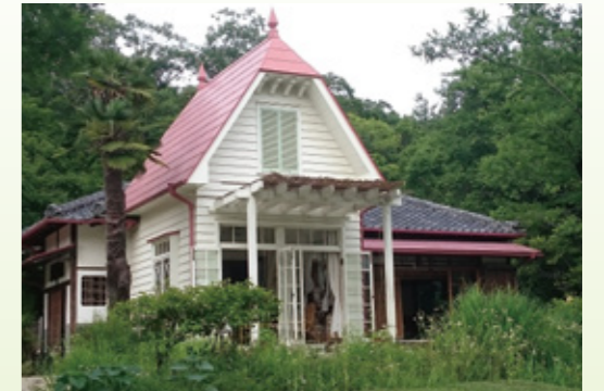
愛・地球博記念公園内にあるサツキとメイの家

本県は5月31日に、スタジオジブリと愛・地球博記念公園に「ジブリパーク(仮称)」をつくろうという方向性で合意しました。2020年代初頭の開設を目指し、スタジオジブリとともに本構想の具体化に向けた検討を進めるための調査費用として2,000万円を計上しました。