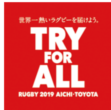
ラグビーワールドカップ2019ロゴ

また、海外からのワールドカップ観戦者は、試合に合わせて全国を移動し、長期間滞在すると見込まれるので、欧州・オセアニアなどをターゲットに、多様なニーズを汲み取り、愛知ならではの歴史、文化、産業、グルメを紹介するなど、インバウンド観光の拡大に向けた対応を戦略的に行っていく。