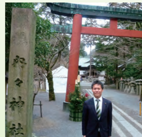
初詣 春日井市 内々神社にて

まずトップをきって、1月14日に台湾の総統選挙が行われ、現職の馬英九総統が勝利しました。この結果を受けての中国と台湾の関係については、今後しっかりとチェックしなければなりません。