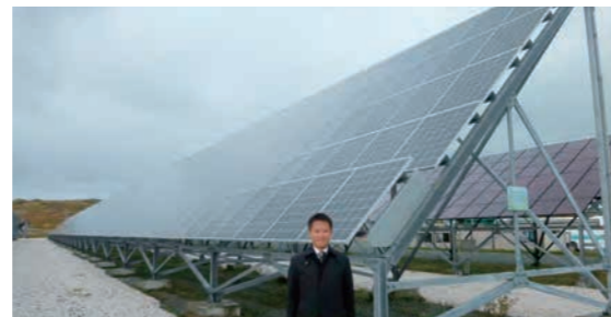
稚内メガソーラー発電所

《知事》 設置数日本一である住宅用太陽光発電をさらに進めるとともに、企業などによるメガソーラーも重要であるとする。県庁を挙げた「電力・エネルギー対策本部」により、スマートコミュニティなど地域分散型エネルギーシステムの推進を図る。