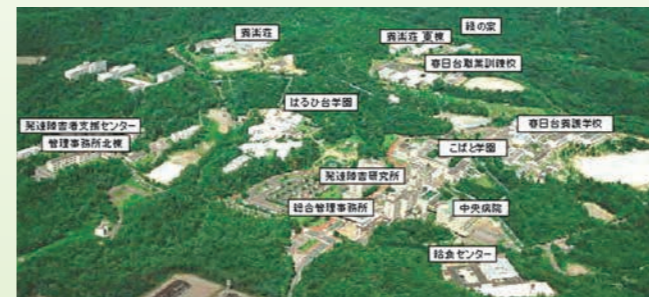
愛知県心身障害者コロニー全景(春日井市神屋町)

愛知県議会11月定例会は、11月29日から12月16日まで開かれ、地域医療再生基金の積立金(※1)や台風15号による災害対策復旧費(※2)などを盛り込んだ約188億円の一般会計補正予算案や、来年4月に発足させる東三河県庁の拠点となる東三河総局を設置する条例改正案など(※3)38議案を可決しました。