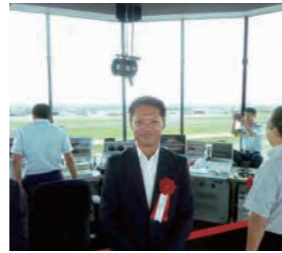
県営名古屋空港管制塔

を生かした利用促進に努める。また、周辺地域を「航空宇宙産業クラスター形成地区」として、小型航空機の開発、生産、整備の拠点を目指し、関係者との連携強化に努めていく。